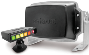
Bild mit optionalem Montagewinkel