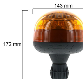
Flexible Rohrmontage, ø 143 x 172mm