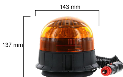
Magnetmontage ø 143 x 137mm